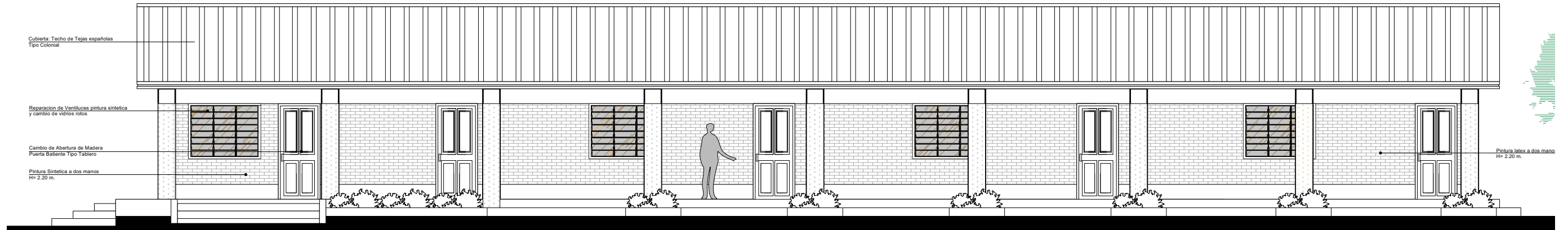
VISTA LATERAL Esc.: 1/50